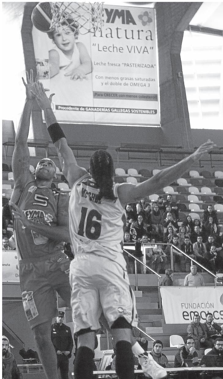
El trinitense, una vez más, fue fundamental